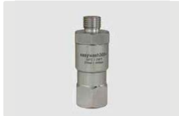
1/4" AG : 3/8" IG. Max. 275 bar / 120 °C