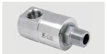
DGE 90°. Gehäuse Messing vernickelt. 1-fach kugelgelagert. Max. 275 bar