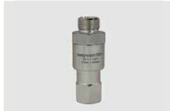
3/8" AG : 1/4" IG. Max. 275 bar / 120 °C