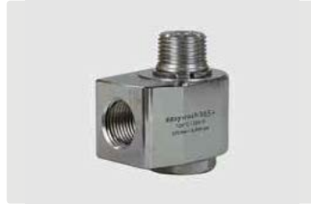
3/8" IG : 3/8" AG. DN 7. Max. 275 bar / 30 U/min / 120 °C