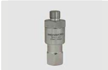
1/4" AG : 1/4" IG. Max. 275 bar / 120 °C

Gehäuse Edelstahl / Messing vernickelt. Achse Edelstahl. Wartungsfrei. DN 6. Anwendungsbereich: Drehgelenke speziell für den Einsatz an Hochdruckpistolen und Schlauchverbindungen, Deckenkreisel in SB-Waschanlagen