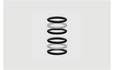
Dichtsätze easywash365+ Drehgelenke