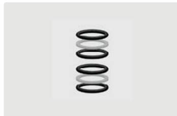
Dichtsätze Mosmatic Drehgelenke WDG