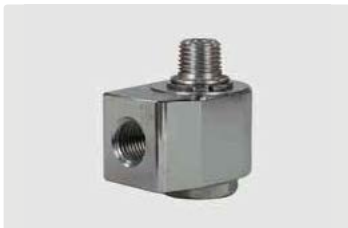
1/4" IG : 1/4" AG. DN 7. Max. 150 bar / 30 U/min / 90 °C

Gehäuse Messing vernickelt. Achse Edelstahl. Anwendungsbereich: Deckenkreisel in SB-Waschanlagen