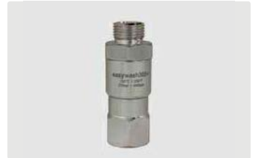
3/8" AG : 3/8" IG. Max. 275 bar / 120 °C