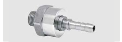
DGS. 2-fach kugelgelagert