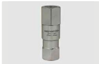
3/8" IG : 3/8" IG. Max. 275 bar / 120 °C