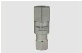
1/4" IG : 1/4" IG. Max. 275 bar / 120 °C