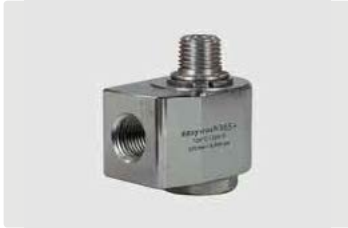
1/4" IG : 1/4" AG. DN 7. Max. 275 bar / 30 U/min / 120 °C

Gehäuse Messing vernickelt. Achse Edelstahl. Anwendungsbereich: Deckenkreisel in SB-Waschanlagen