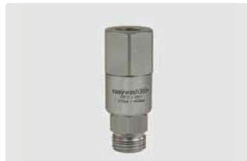
1/4" IG : M18 AG. Max. 275 bar / 120 °C